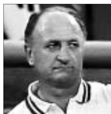
L. FELIPE SCOLARI

Declarado culpable por doparse en el Tour 2006 en el que resultó vencedor, el ciclista estadounidense ha sido sancionado con dos años de inhabilitación. Sólo su posibilidad de apelación priva aún de la corona de ganador al gallego Óscar Pereiro.